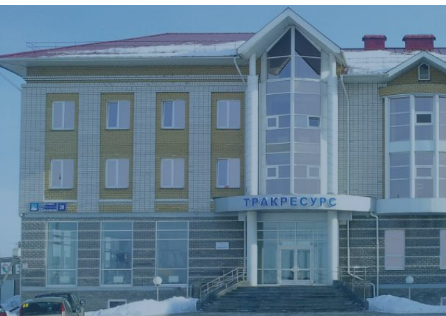
Здание главного офиса в г. Набережные Челны

Москва +7(495) 645 01 14 office@liftnet.ru